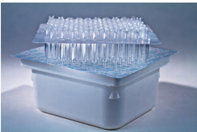
1-ml-Spritzen aus COP, „ready to fill“.

Was immer kommen wird: Transcoject wird seine Kunden mit neuester Technologie und effizienten Produkten dabei unterstützen, wettbewerbsfähig zu sein.